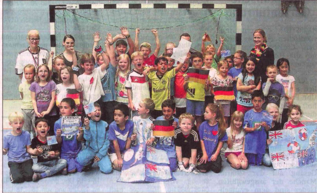
Großen Jubel gab es während der Siegerehrung.

Doch die Tore von Dion – gegen Russland (2c) siegte Italien 2:0, und gegen Japan (2b) gab es eine 0:3 Niederlage – reichten am Ende nicht aus, das Team landete hinter Japan und Australien (1b) vor Chile (1a) auf dem dritten Platz. „Wir haben aber mehr erreicht als die